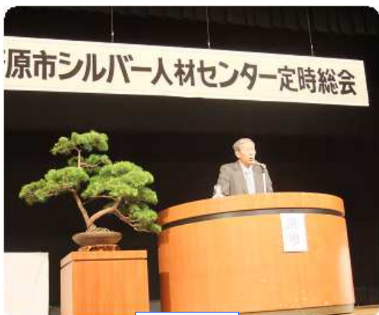
理 事 長