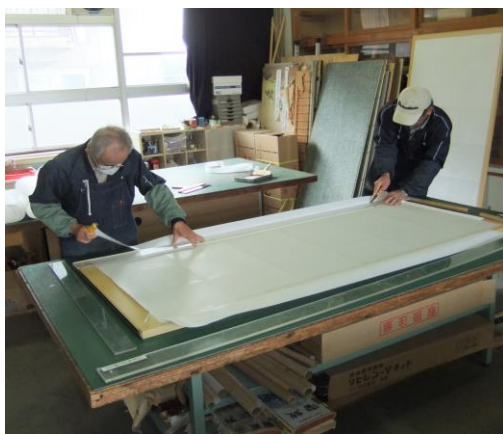
襖・障子の張替え 作業

※本数や種類にもよりますが、作業期間は 1 日～2 日で完成します。襖・障子・網戸の張り替えは、お客様の自宅へ取りに伺い、張り替え後、お届けいたします。