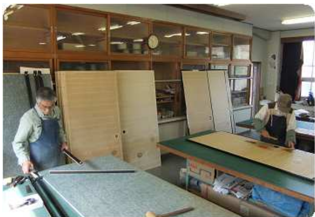
襖・障子の張替え 作業

網戸の張替えは通常 8 本程度までは 1 日で完成します。襖張替えの作業期間は通常 1 泊 2 日ほどになります。