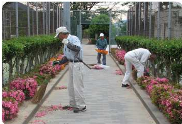
草取り・清掃 作業

襖・障子・網戸の張替えは、各依頼者の御自宅へ取りに伺い、張替え後、お届けいたします。詳しくは事務局までお問い合わせください。